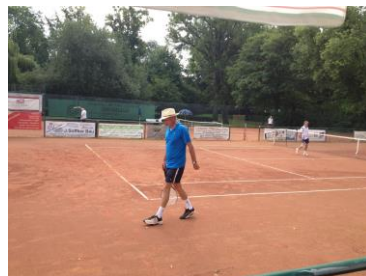
Mit Hut spielt man in Bad Eilsen!