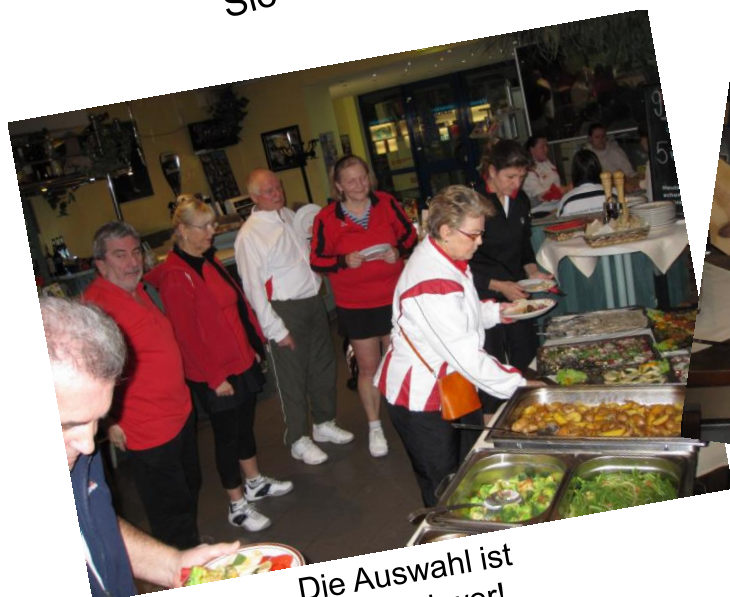
Die Auswahl ist schon schwer!