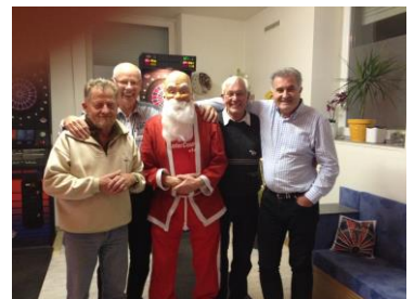
Beistand vom Nikolaus für die kommende Saison vereinbart!