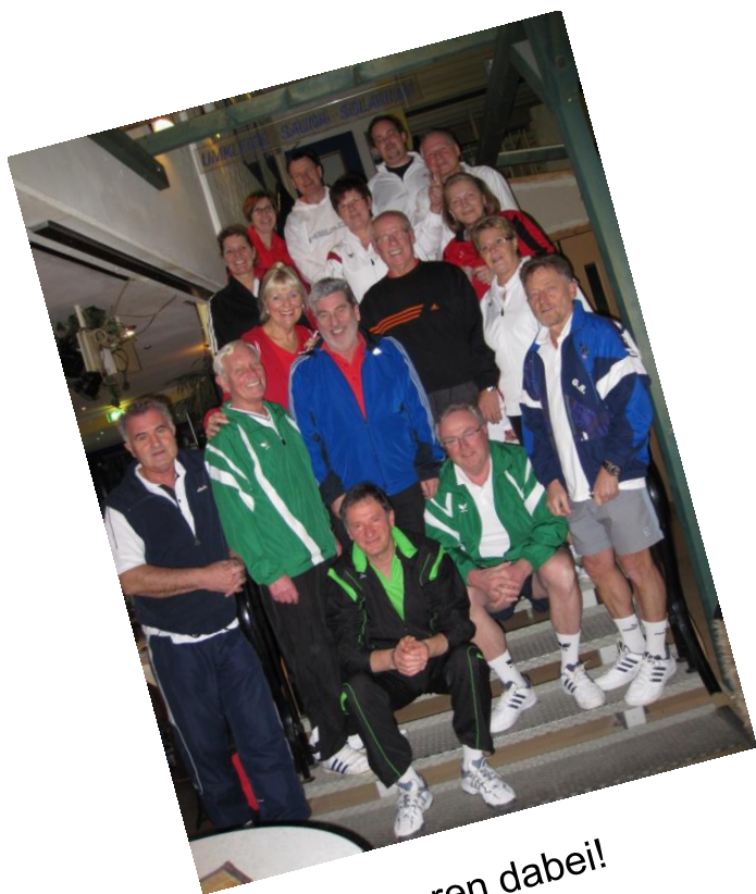
Sie waren dabei!

In diesem Jahr haben wir uns wieder in Empelde vorbereitet. Es hat sehr viel Spaß gemacht und gut gegessen haben wir auch.!